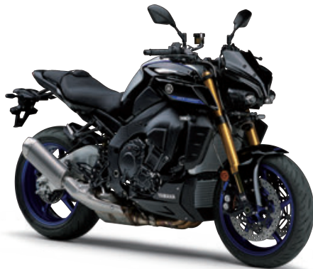
ブルーイッシュホワイトメタリック2(シルバー)