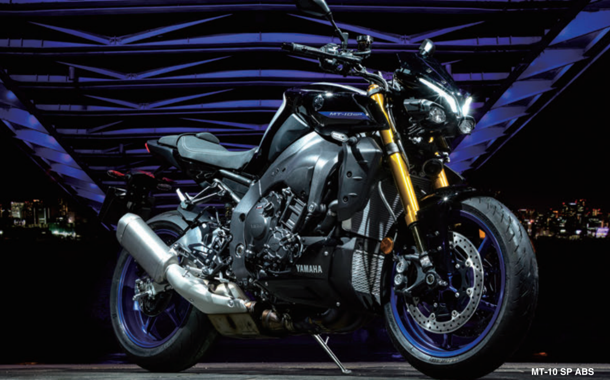
MT-10 SP ABS