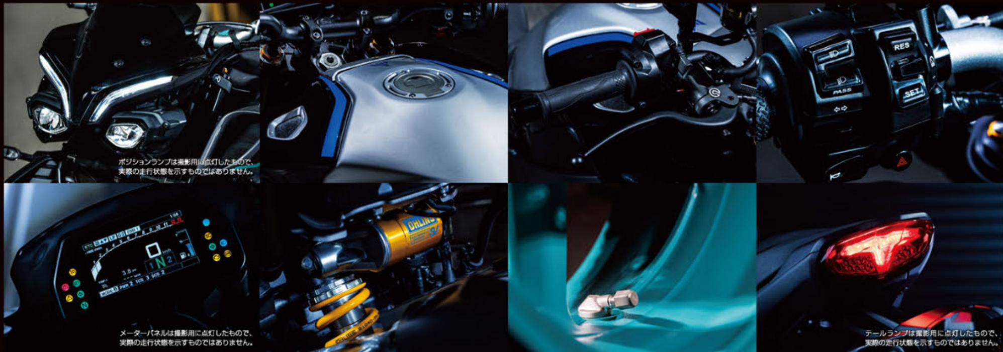
ポジションランプは撮影用に点灯したもので、実際の走行状態を示すものではありません。