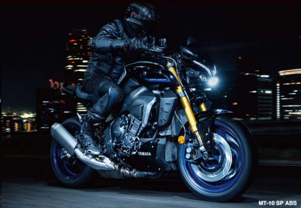
MT-10 SP ABS

写真は海外で撮影されたもので、仕様が国内とは一部異なります。またクローズドスペースで撮影されたものです。