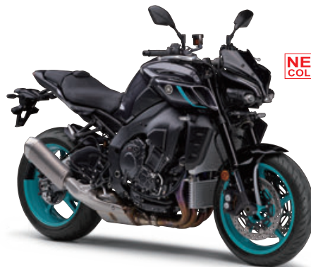
ダークブルーイッシュグレーメタリック8(ダークグレー)