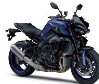
ディープパーブリッシュブルーメタリック(ブルー)