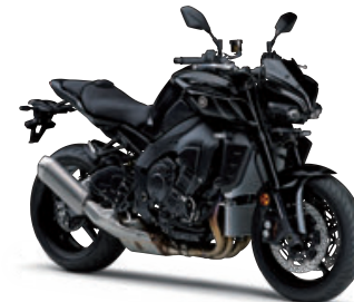
マットダークグレーメタリック6(マットダークグレー)