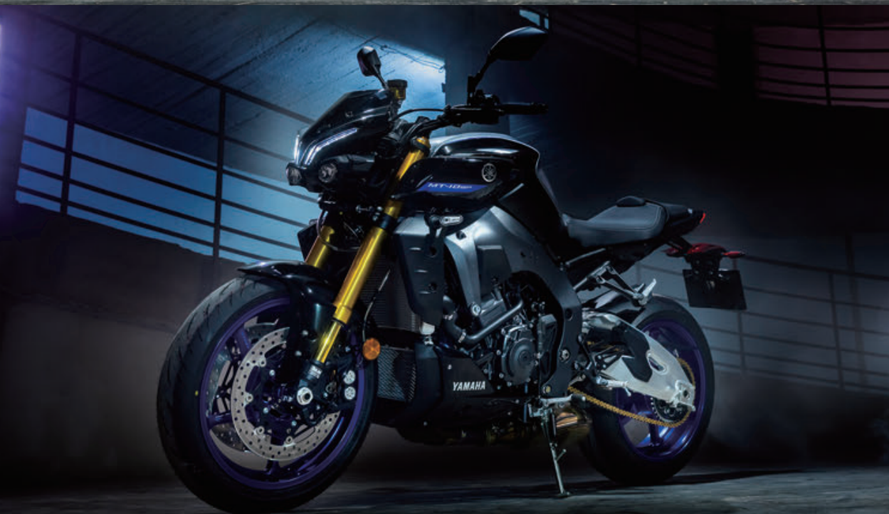
MT-10 SP ABS

写真は海外で撮影されたもので、仕様が国内とは一部異なります。写真は合成によるイメージです。またクロードスペースで撮影されたものです。ポジションランプ、テールランプは撮影用に点灯したもので、実際の走行状態を示すものではありません。