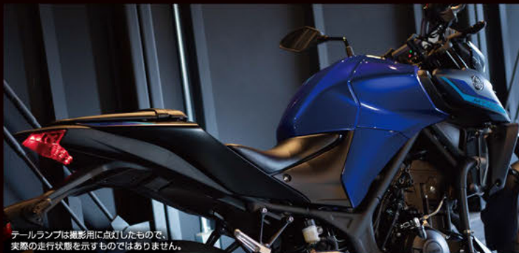
テールランプは撮影用に点灯したもので、実際の走行状態を示すものではありません。