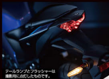
テールランプとフラッシャーは撮影用に点灯したものです。

■機敏なハンドリングを追求したアップライトなバーハンドル 市街地での乗りやすさを求め、ハンドルはアップライトなポジションに。また倒立式フロントサスペンションに合わせ、アルミ鋳造製ハンドルクラウン・スチール鍛造製アンダーブラケットを装着。扱いやすく、自然な操舵感で機敏な走りを楽しめる。