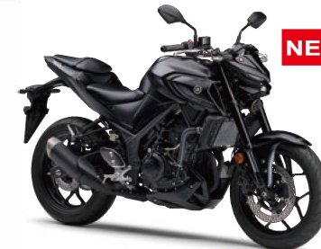
マットダークグレーメタリック8(マットダークグレー)