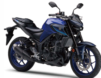
ティーパーブリッシュブルーメタリックC(ブルー)