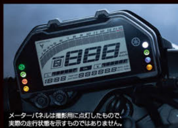
メーターパネルは撮影用に点灯したもので、実際の走行状態を示すものではありません。