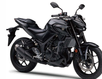
マットダークグレーメタリック8(マットダークグレー)