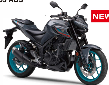
パステルダークグレー(グレー)