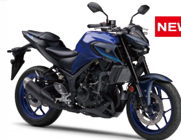
ティーパーブリッシュブルーメタリックC(ブルー)