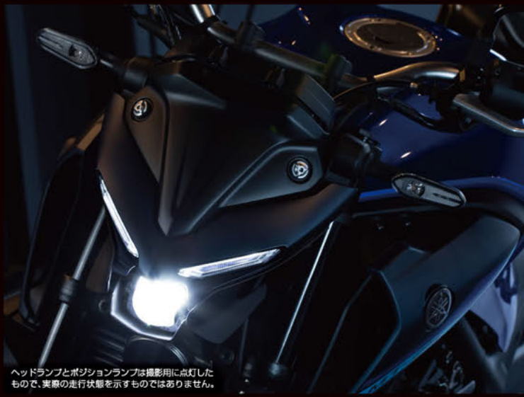
ヘッドランプとポジションランプは撮影用に点灯したもので、実際の走行状態を示すものではありません。

パステルダークグレー（グレー）はホイール、グラフィックにシアン（シアンソリッド6）を配し、鮮やかさと次世代MTシリーズ共通の強い個性を主張。ディープパーブリッシュブルーマタリックC（ブルー）はブルーを基調にマットダークグレーとマットブルーを組合せ、YZF-R1とリレーションするパフォーマンスカラー。マットダークグレーメタリック8（マットダークグレー）はダークトーンのローコントラストで、シリアスにパフォーマンスを表現している。