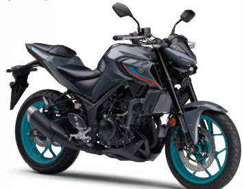
パステルダークグレー(グレー)