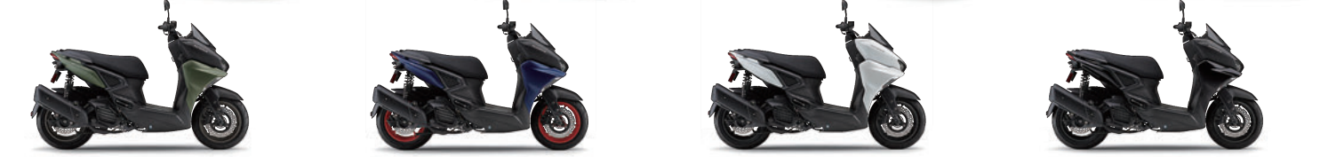
マットダークグレイッシュリーフグリーンメタリック2 (マツグリーン) マットダークパーブリッシュブルーメタリック1 (マツブルー) ブルーイッシュホワイトパール1 (ホワイト) ブラックメタリックX (ブラック)