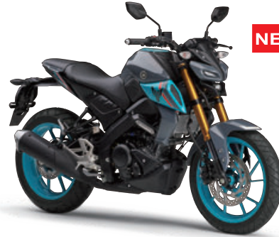
パステルダークグレー(グレー)