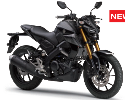
マットダークグレーメタリック8(マットダークグレー)