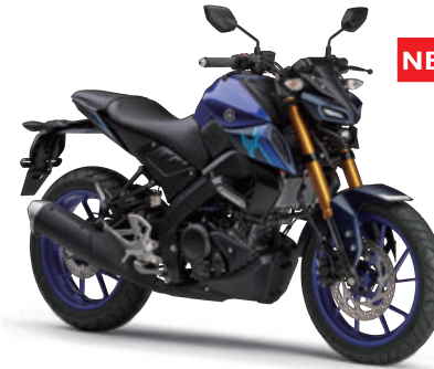
ティーパーブリッシュブルーメタリックC(ブルー)