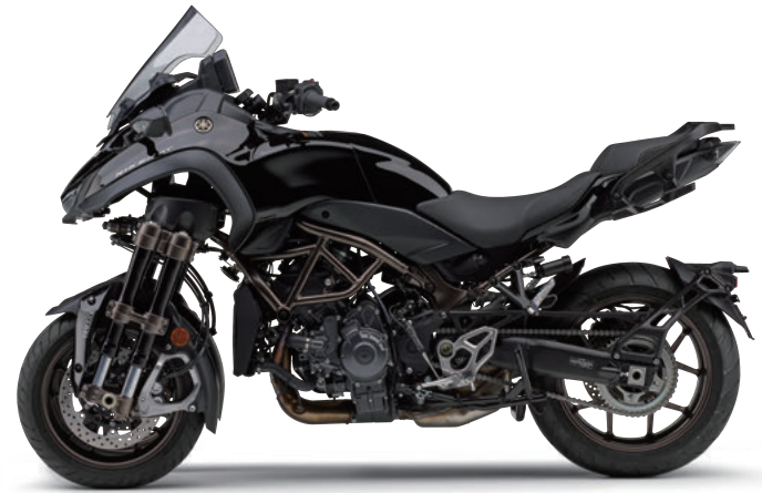
ヤマハブラック(ブラック)