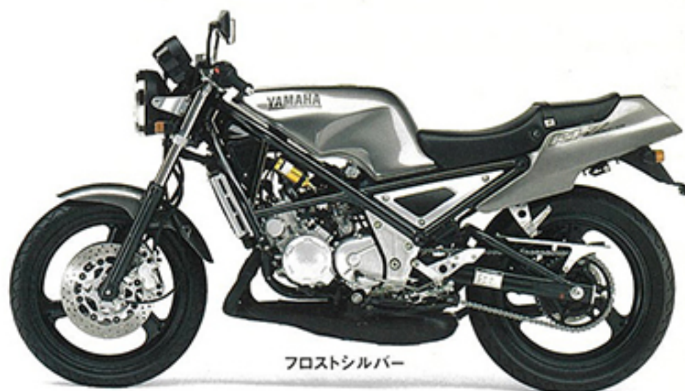
フロストシルバー