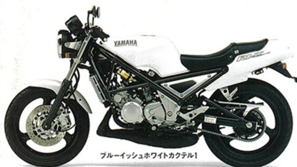
ブルーイッシュホワイトカクテル1