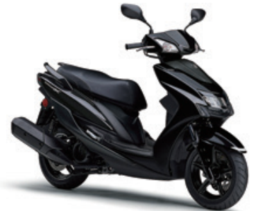
ブラックメタリックX (ブラック)