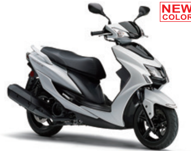
ブルーイッシュホワイトカクテル1 (ホワイト)