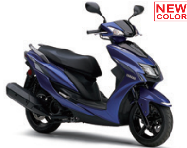
ディープパーブリッシュブルーメタリックC (ブルー)