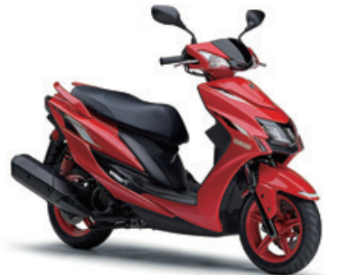
ビビッドレッドメタリック5 (レッド)