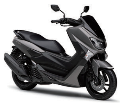
マットグレーメタリック3(マットグレー)