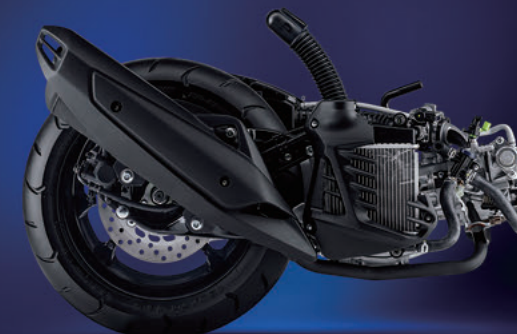
※写真は海外仕様で、一部国内仕様とは異なります。