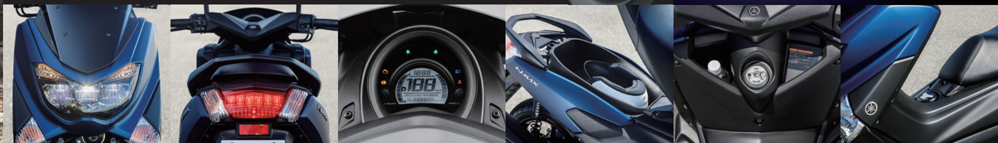
※ヘッドランプ、ポジションランプ、テールランプおよびメーターパネルは撮影用に点灯したもので、実際の走行状態を示すものではありません。