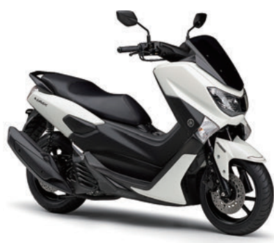
ホワイトメタリック6(ホワイト)