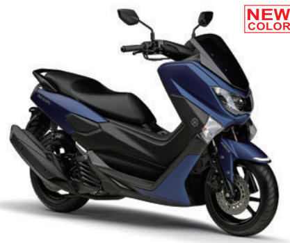
マットダークブルーメタリック5(マットブルー)