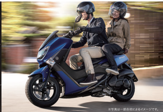
※写真は一部合成によるイメージです。