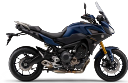
マットダークパーブリッシュブルーメタリック1(マットブルー)