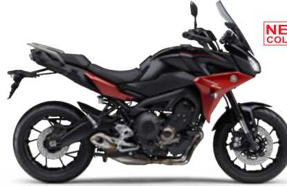
マットダークグレーメタリック6(マットダークグレー)