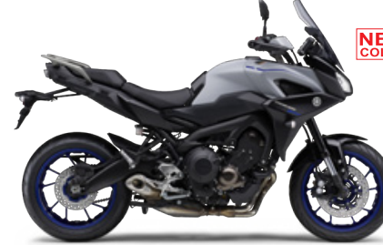
マットブルーイッシュグレーメタリック3(マットグレー)