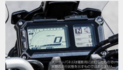
メーターパネルは撮影用に点灯したもので、実際の走行状態を示すものではありません。