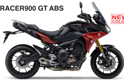
マットダークグレーメタリック6(マットダークグレー)