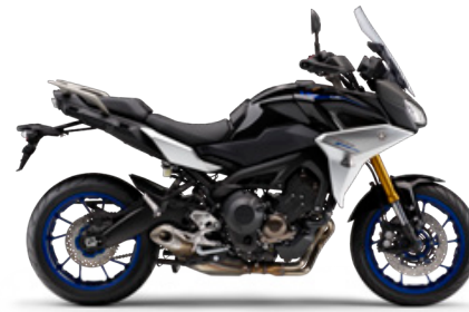
ブラックメタリックX(ブラック)