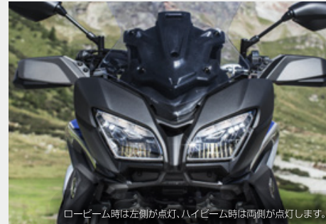
ロービーム時は左側が点灯、ハイビーム時は両側が点灯します。

ポジション、ハイ・ローともにLEDを使用。リフレクター形状の中にLED発光体を埋め込むことにより、特徴的なフロントフェイスを演出。