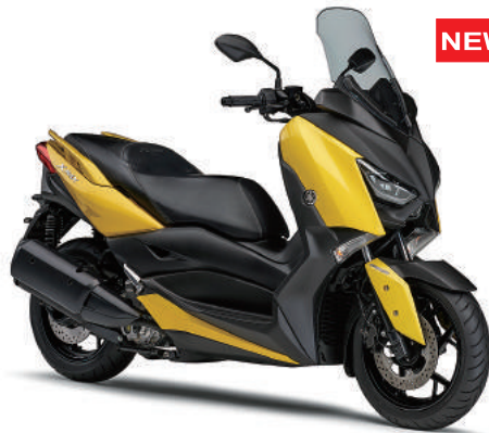
イエローメタリック 6 (イエロー)