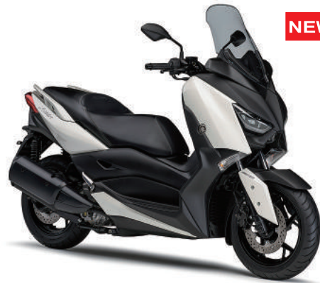
ホワイトメタリック 6 (ホワイト)