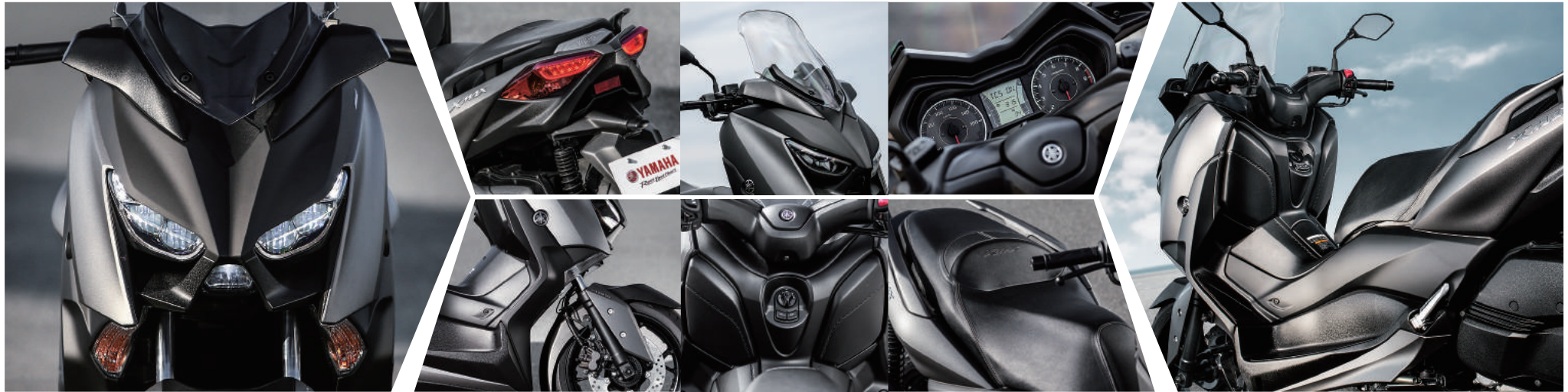
※ヘッドランプとテールランプ、およびメーターパネルは撮影用に点灯したもので、実際の走行状態を示すものではありません。

インテリアも、細部の仕上げと質感にこだわりました。左右のフロントバンクのリッドからトンネル部にかけて、職人手づくりの成形型によるテクスチャーラインを施し質感を向上させています。