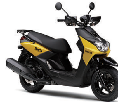
ビビッドイエローソリッド2 (イエロー)