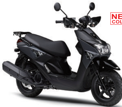
ダークブルーイッシュグリーンソリッドC (グレー)