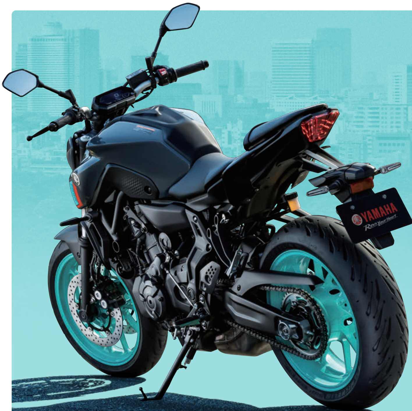
パステルダークグレー(グレー)