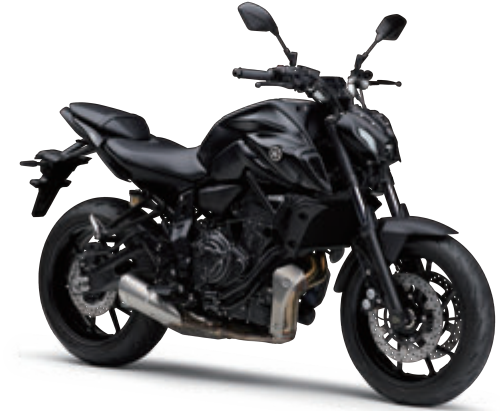
マットダークグレーメタリック6(マットダークグレー)