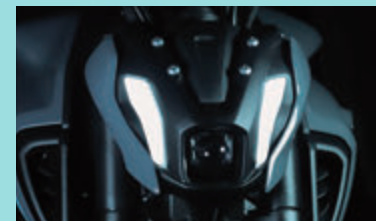
ポジションランプは撮影用に点灯したもので、実際の走行状態を示すものではありません。

機能パーツの集合体とし、メカニカルな表情のLEDプロジェクターヘッドランプは、ロービームとハイビームを一体型とした2機能タイプ。ロービームは、照射エリアとエリア外の境界の明暗差が少なく穏やかで、境界付近での良好な視認性を実現している。またポジションランプ、フラッシャーランプにもLEDを装備。ポジションランプは左右独立でイニシャル「Y」をモチーフとし、コンパクトなヘッドランプ周りが一目でMT-07と分かるデザインとなっている。