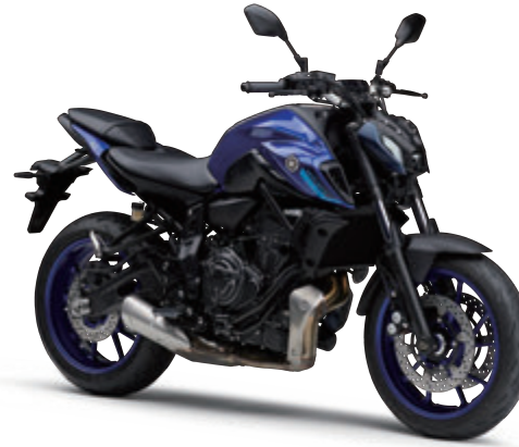
ティーパーブリッシュブルーメタリックC(ブルー)