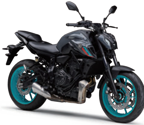
パステルダークグレー(グレー)