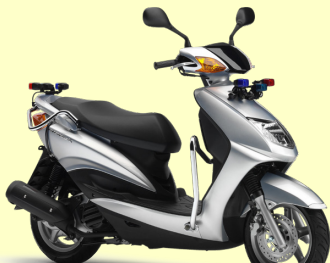
シグナス 125 教習車