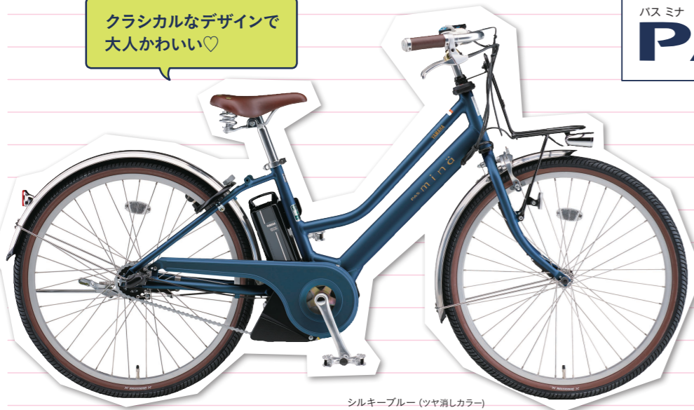
シルキーブルー (ツヤ消しカラー)