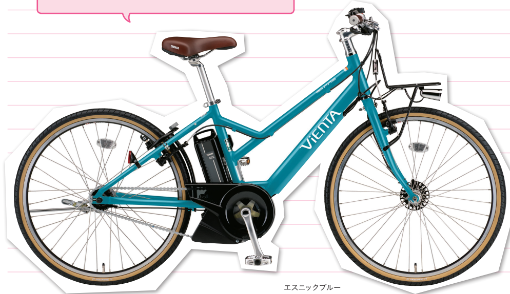
エスニックブルー