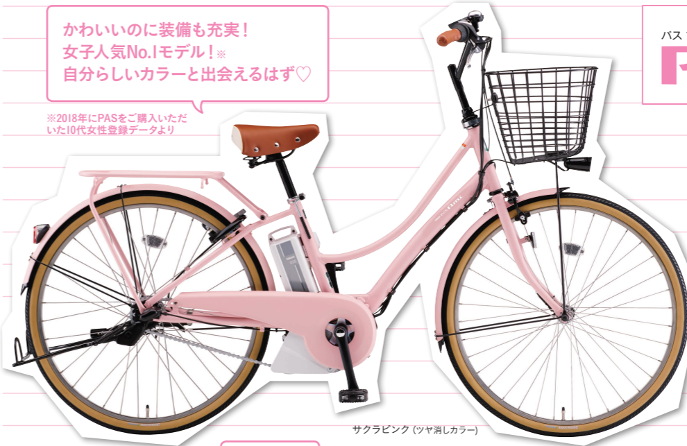
サクラピンク (ツヤ消しカラー)