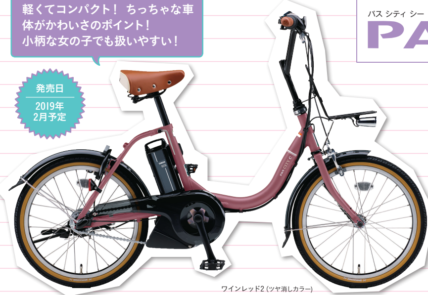
ワインレッド2 (ツヤ消しカラー)