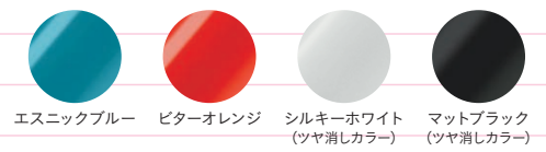
エスニックブルー ピターオレンジ シルキーホワイト (ツヤ消しカラー) マットブラック (ツヤ消しカラー)