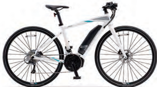
Pure White (写真はM size)