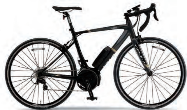
Solid Black / Dark Gray(写真はM size)

PWDドライブユニットと小型軽量バッテリーをベースに、「軽さ」「デザイン」「巡航性能」を追究。 スポーツバイク本来の軽快感に加え、アシストによる心地よい加速フィーリングと走行性能を実現。 軽快な乗り心地とアシストの恩恵をバランス良く融合した電動アシストロードバイク。