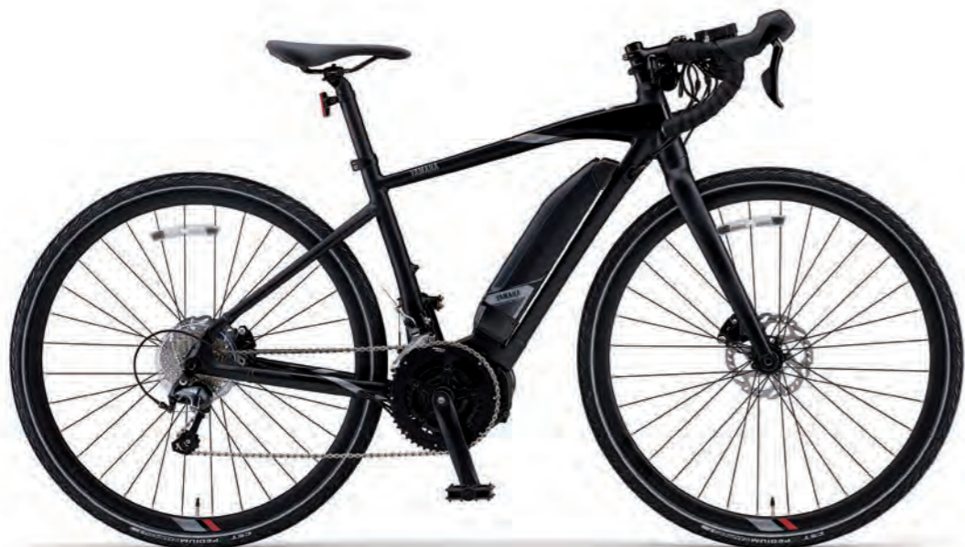
Mat Black 2 (写真はM size)

ディスクロードバイクのトレンドを取り入れ 通勤&週末ツーリングに応える拡張性を秘めた1台。