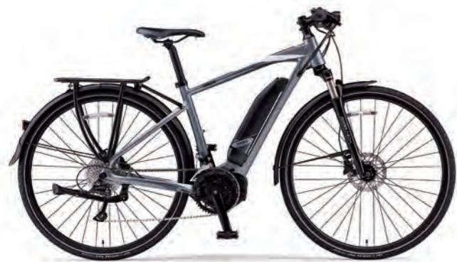
Satin Silver (写真はM size)

通勤や街乗りはもちろん、長距離ツーリングにも対応できるスペックと拡張性で幅広いニーズに応えるオールマイティな1台。