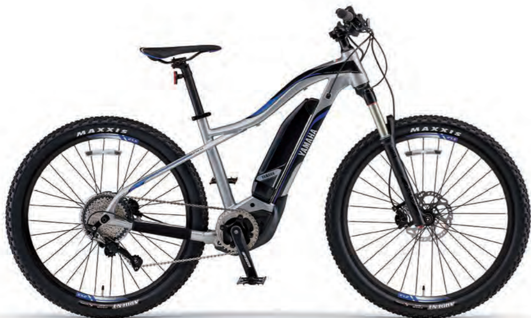
Mat Pure Silver (写真はM size)

E-MTB向けフラッグシップドライブユニット[PW-X]搭載。 ヤマハが培ってきた走りのDNAと、 パワフル&コントロールなアシスト性能を楽しむモデル。