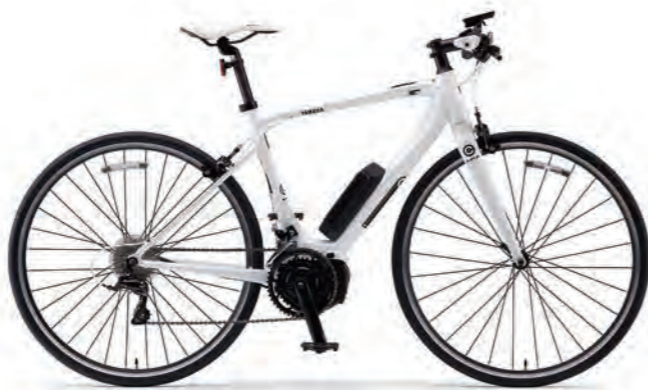
Pure White (写真はM size)