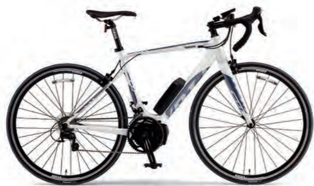
Pure Pearl White(写真はM size)