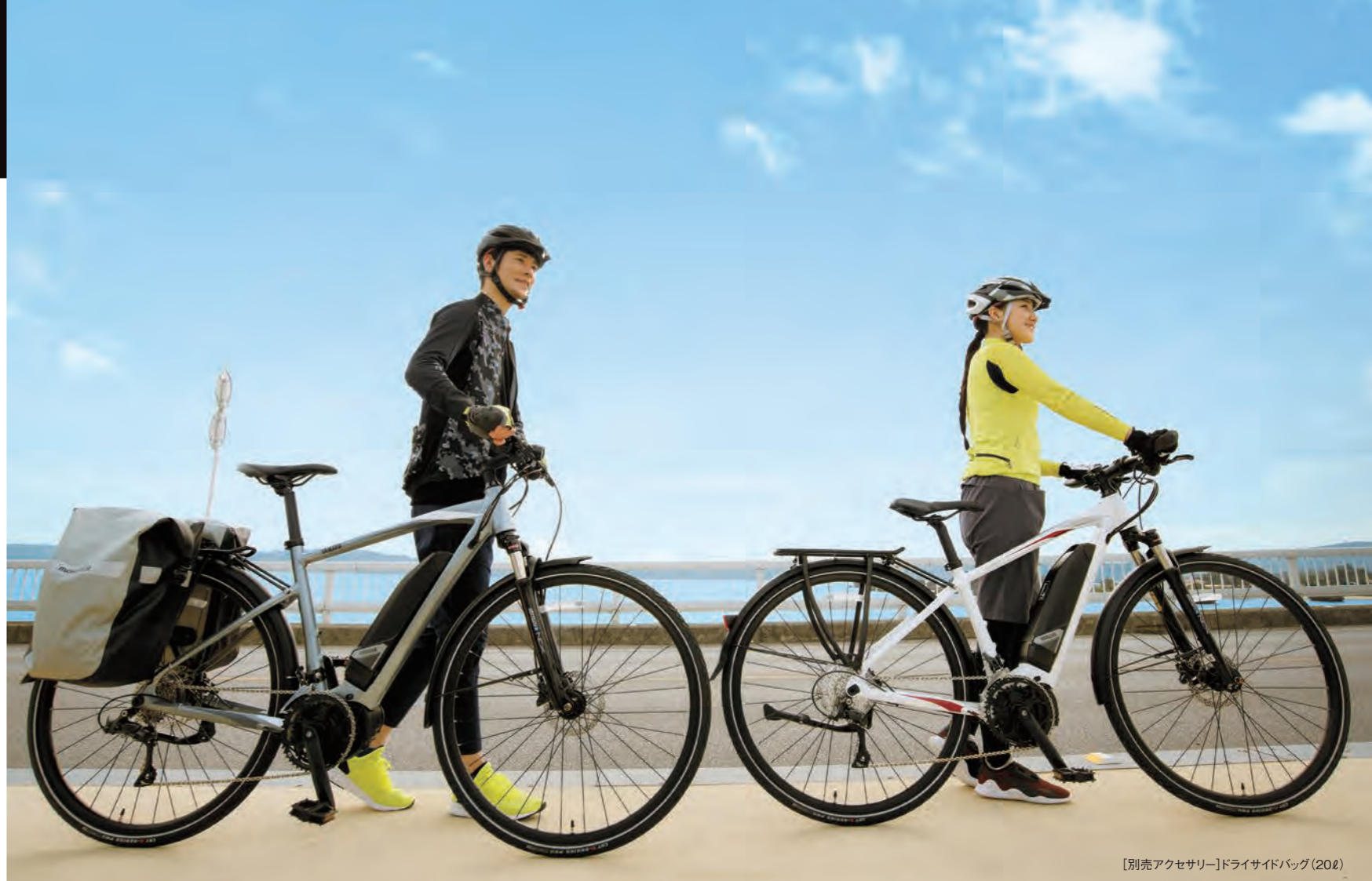
[別売アクセサリー]ドライサイドバッグ(20ℓ)