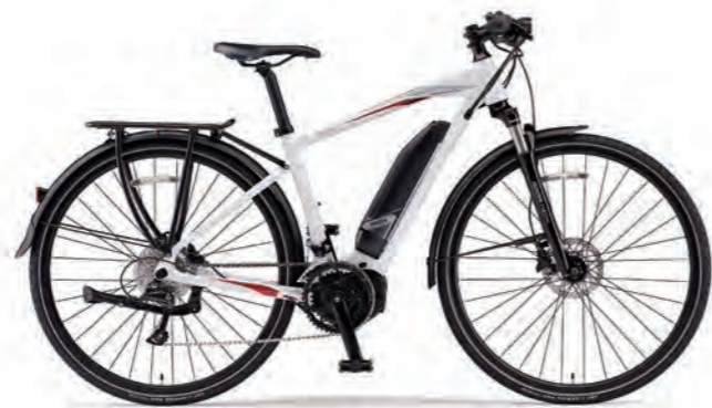
Pure Pearl White (写真はM size)