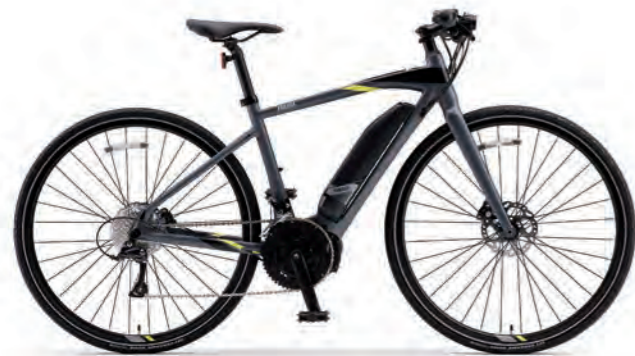
Mat Dark Gray (写真はM size)

本格派ロードバイクを扱いやすいフラットバーハンドル仕様に。 毎日の走りのギアが一段上がる。 通勤もツーリングも快適ライディングを楽しむ万能バイク。