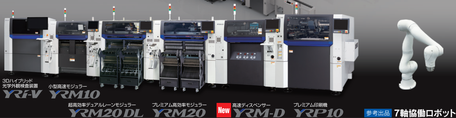
3Dハイブリッド 光学外観検査装置