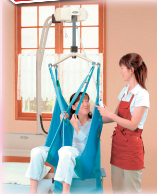
移動支援・移乗介助用具ゾーン