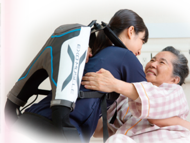
介護ロボットゾーン