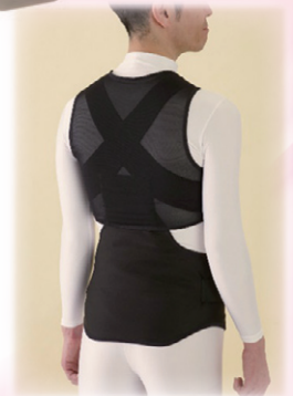
ひょうごKOBÉ 企業ゾーン